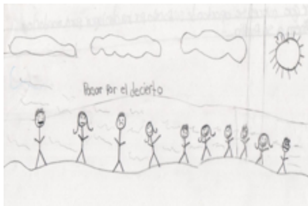
Figura 2. El desierto (niña, 10 años)