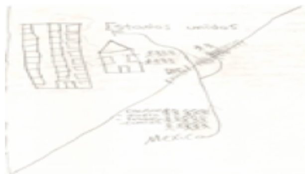
Figura 6. La frontera (niña, 10 años)

Escobar, Hurtado, Pimentel, Rodríguez, y Santamaría (2008), mencionan que los hijos de migrantes que no emigran, suelen pasar a ser parte de las familias quebrantadas, puesto que la herida de sus integrantes es permanente y con la posibilidad de crecer, puesto que hay tensión, ya sea por el distanciamiento o la pérdida total de la persona que emigró y la probable presión