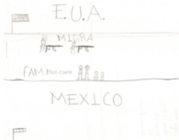
Figura 5. La frontera (niño, 10 años)

le estaba disparando”; “Es injusta porque los policías les pegan, ellos no tiene la culpa, hasta las mamás se van y se llevan a sus hijos, pero a veces los dejan en la frontera. Está muy bien que las señoras les den de comer a los migrantes y tengan en donde descansar”; “Cuando el carro lleva carga y también gente y la baja al otro lado y tienen que pasar por el agua y si te ve la policía te meten a la carcel”; “Habia una vez tres compadres que querían cruzar la frontera por el río bravo, primero paso Julio y cuando estaba pasando Pancho el de la migra le disparo.”