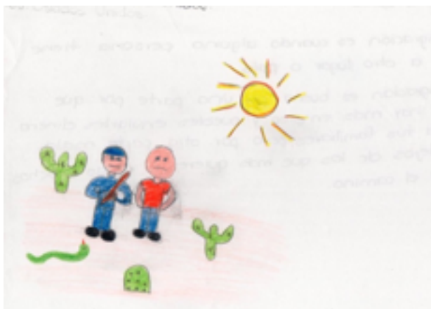
Figura 1. La migra (niño, 11 años)

Mi papa se fue a Estados Unidos porque estaba muy dura la crisis y llo tenía 2 años y no lo e visto pero algun dia ba a regresar pero nos “miantiono” se fue de mogado por nos dise que aorita esta muy dura la crisis pero alla tiene ganas de venirse porque lla tiene mucho alla y es muy triste no tener aquí a sus familiares.